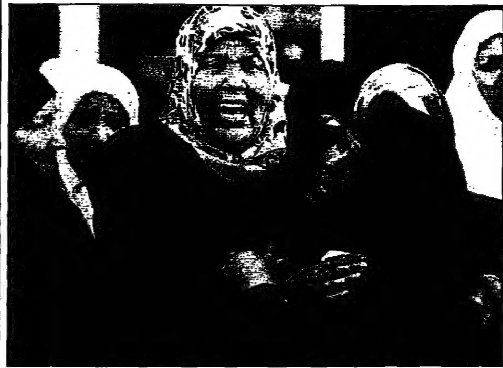
قربان شهداء حزب الله في بيروت بعد انفجار عبوة ناسفة في جنوب لبنان

واشنطن (ا ب ت) - رويترج - قال مسؤولون في الجيش الإسرائيلي ان مقاتلي حزب الله اطلقوا قذائف موزون على قلعة حراسة تابعة لبيروت... (Main article text)